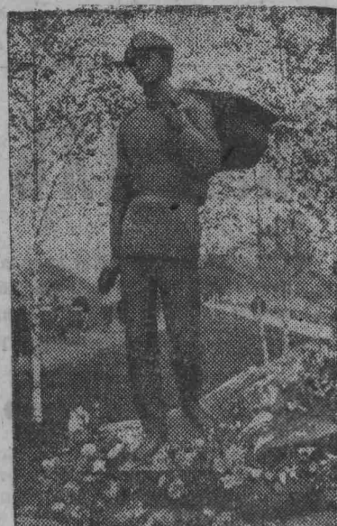
На снимке: памятник Сергею Есенину.

В Москве на бульваре, носящем имя Сергея Есенина, установлена скульптурная композиция — памятник великому русскому поэту. Он выполнен московским скульптором В. Цигалем. Архитекторы — С. Вахтангов и Ю. Юров.