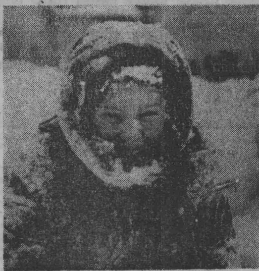
ФОТО САЛОН «ЛЕНИНСКОГО ШАХТЕРА»

Вечерет. И в бору все тише Легкий сумрак к сосняку ползет. За деревней хор нестройный слышен, Приутих березок хоровод. Нам с тобой, кочующим туристам, Под сосновый тихий гаворон Хорошо послушать птички свисты И смотреть на вьюющийся дымок. Уплывают, затихая, звуки, Растворившись в сумрачный пейзаж. Посмотри, как жадно просят руки Заскучавший за день карандаш. Что ж, давай запишем эту встречу С тихим бором у Бобровки в стих. Пусть сегодня уходящий ве- чер Погрустит немного за двоих.