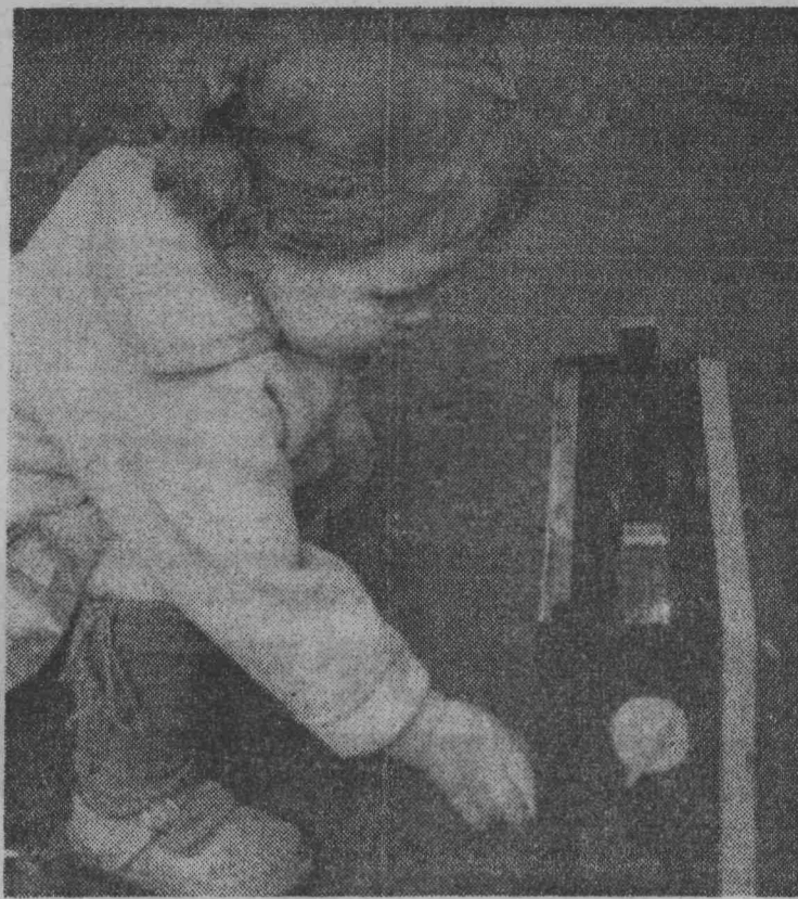
ФОТО САЛОН «ЛЕНИНСКОГО ШАХТЕРА»