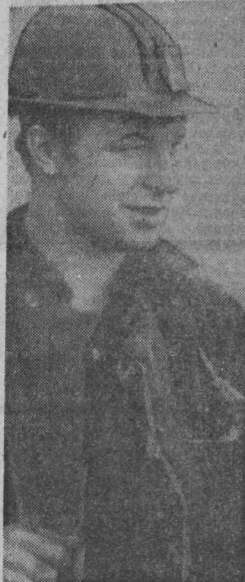
Горняки очистного участка № 7 шахты «Комсомолец» постоянно трудятся с нагрузкой на механизированный комплекс по 1200 и более тонн.

Г. САРАЕВ, электрослесарь, Шахта «Кузнецкая».