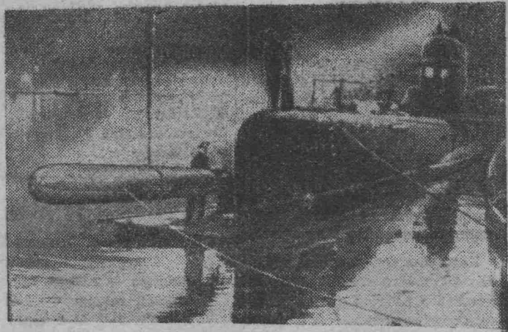
Перед походом. Идет погрузка торпед.