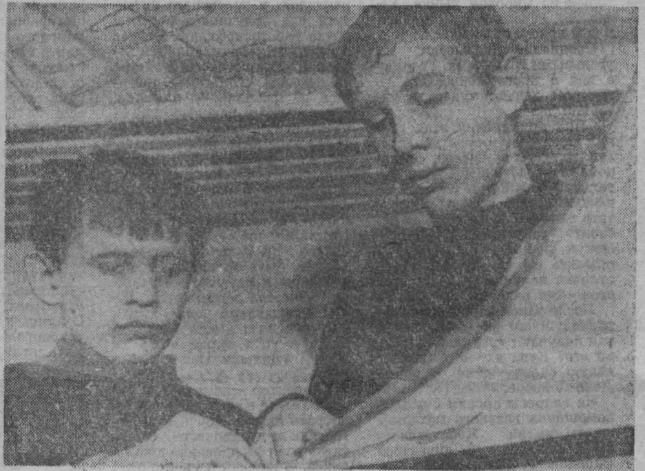
Детская комната «Юность Кузбасса» при домоуправлении № 4 треста «Ленинскшахтострой» расположена по проспекту Кирова, 60.

Здесь активно действуют спортивные кружки, кружки рисования, выжигания, музыкальный, шахматно-шашечный, секция КВН. Занятия проходят один раз в неделю строго по расписанию.