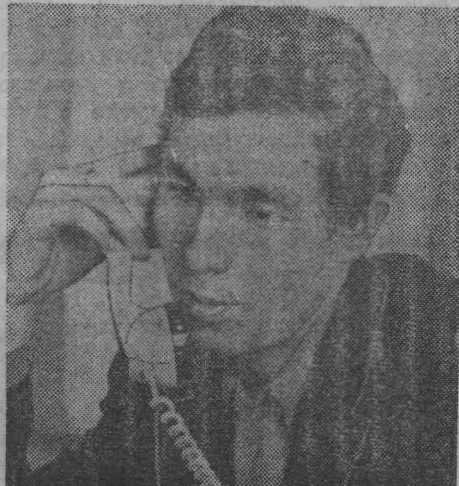
вспоминаются ему родные края, манят к себе места, где прошли детство и юность. Но надо ли выбирать, отдавать предпочтение тому или другому уголку нашей страны, ведь каждый из них — наша Родина.