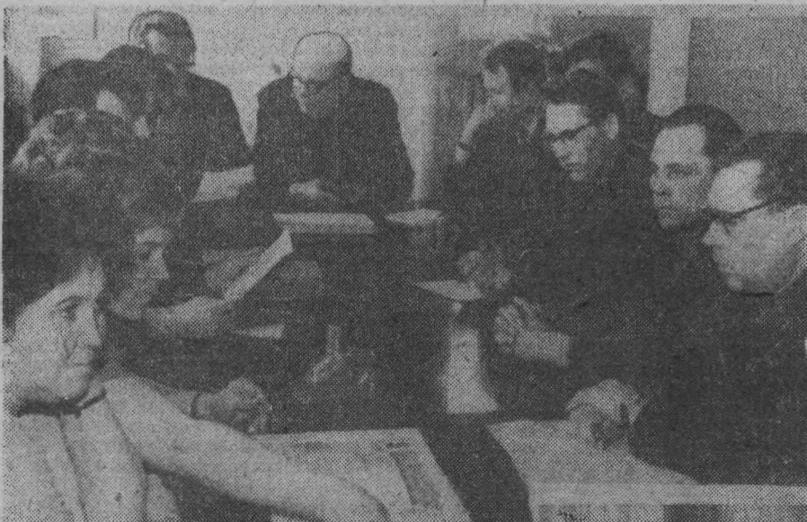
Выработать реальный план социального развития коллектива с учетом запросов трудящихся и перспектив на ближайшие пять лет — этим занимается в настоящее время специальная комиссия шахты «Октябрьская».

На снимке: члены комиссии за обсуждением одного из разделов плана.