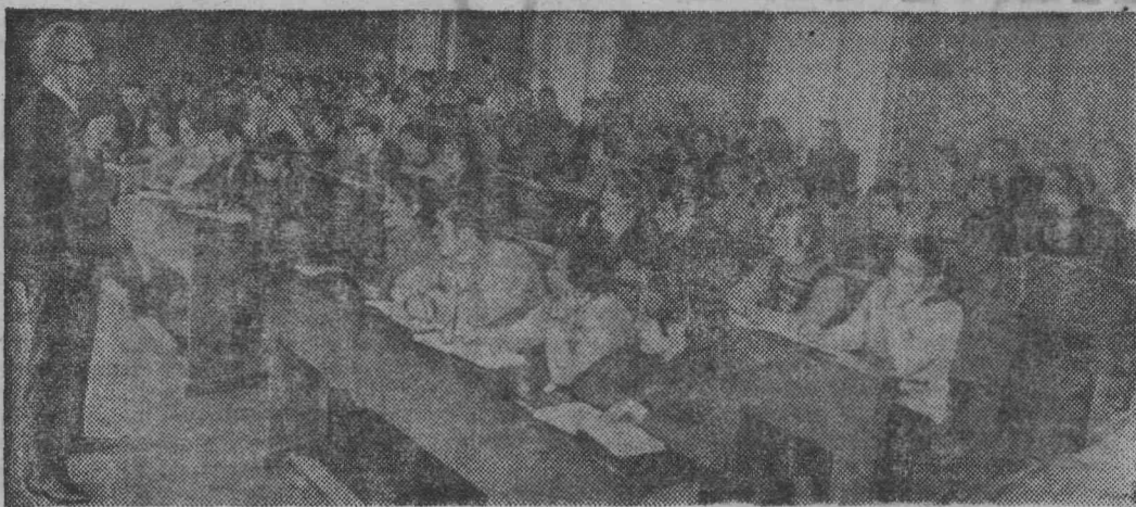
Юго-Осетинская автономная область, входящая в состав Грузинской ССР, 20 апреля 1972 года празднует свое 50-летие. Неузнаваемо преобразился этот горный край за годы Со-

На снимке: сбор огурцов.