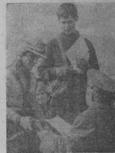
Выдался на редкость солнечный день. На традиционный мотогонки имени лет-

чика-космонавта А. Леонова прибыли спортсмены из городов Новокузнецка, Кемерово, Томска, Прокопьевска, Белова, Осинников, Перми.