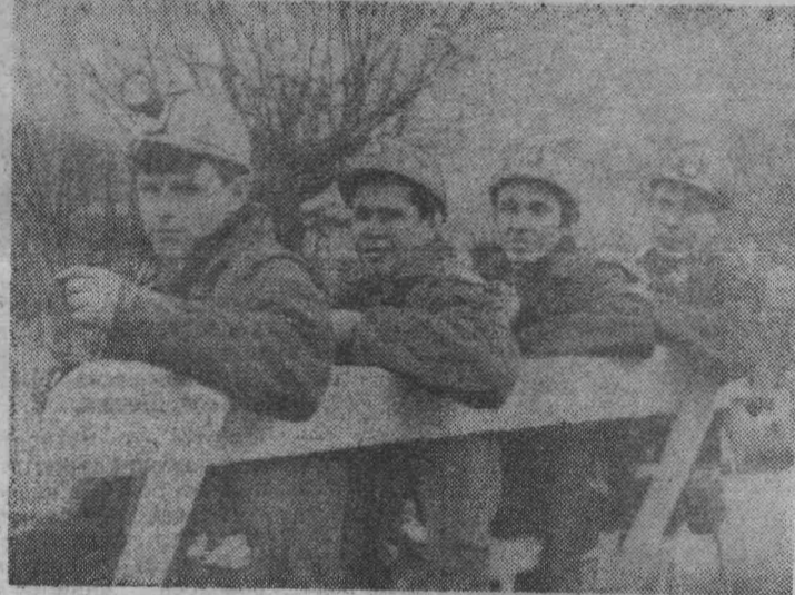
Горняки участка № 5 шахты имени Ярославского несут предмайскую вахту. Они решили дать Первомаю 5500 тонн угля сверх плана, и уже близки к выполнению своего обязательства.