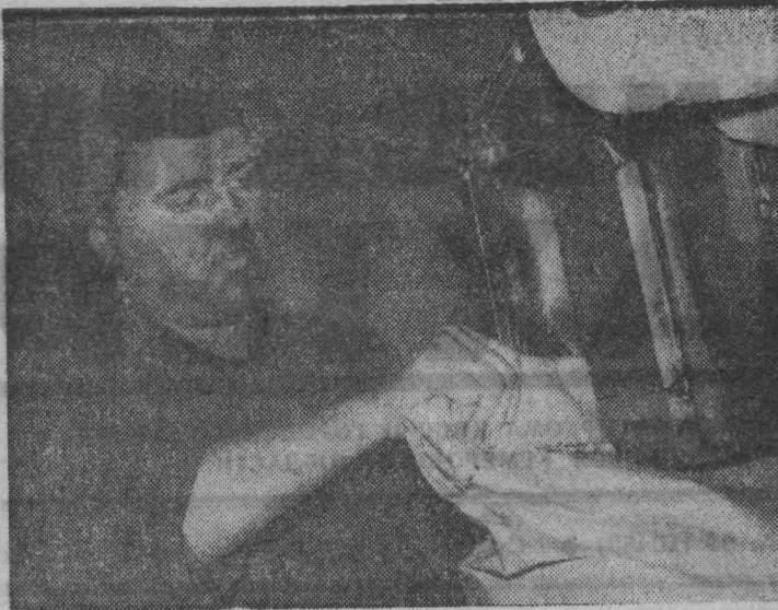
Фабрика гранулированного порошка. По транспортеру к месту погрузки готовой продукции на машины один за другим едут мешки. Монотонно гудит дозатор. Женщины-дозаторщицы быстро заполняют мешки угольным порошком, зашивая их на машинке. Это конечное звено всей технологической цепочки по изготовлению гранулированного порошка, который