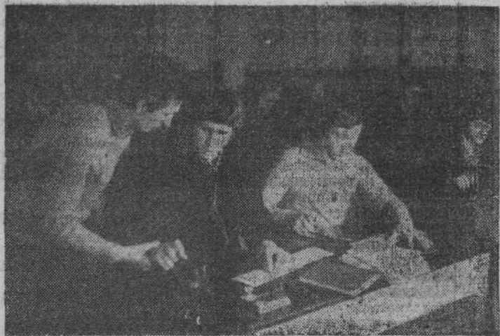
Творческая студия «Панорама».