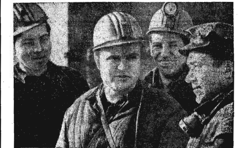
Коми АССР. Отлично трудятся в решающем году пятилетки горняки шахты «Интинская» комбината «Интауголь». Каждый день они добывают 200—250 тонн угля сверх задания.

Если полусаевцы недовольны своим Домом быта, то горожане не в меньшей претензии к пятому ателье. Вот уж поистине кому не повезло, так это гражданке Ф. Рудакову, который имел неосторожность воспользоваться услугами этого учреждения. Правда, Ф. Рудаков (очевидно, не лишены чувства юмора) объяснил свои неудачные визиты в ателье № 5 «незвучимым» числом 13, в