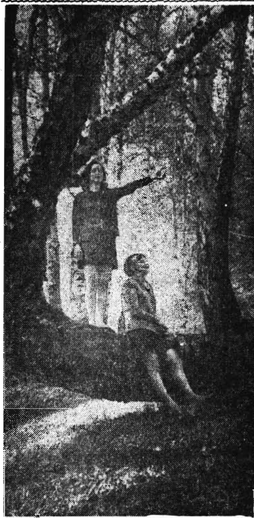
ПОД БЕРЕЗАМИ.

И вот из всплесков пены мутной, Из перестуков, через гуд, Как будто разрывая путы, Бслед быстротечности минут, Азартом будоража взрослых (Прислушайся — в ушах звенит) Пробился миг, который после Ничто не вольно заслонит. Сначала — шум, вдали и рядом. В ладони неба — в голубень — Встревоженно над эстакадой Взметнулась стая голубей. И — хлынул уголь: легкой струйкой Поном все гуще, все полней — На наши вскинутые руки, На почерневший сразу снег. На зуб, — шутя, — на цвет, на ошупь Проверив теплый концентрат, Мы вдруг заметили и почки, Неразлучимые с утра, И потончавшие сосульки, И высоко парящий флаг. И точно вспомнили, что сутки, Вторые сутки на ногах.