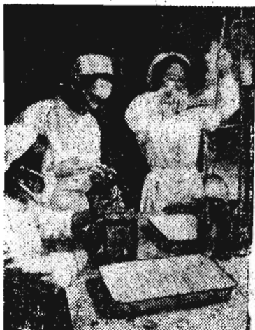
Фармакологические предприятия ДРВ наладили выпуск лекарственных препаратов по рецептам древней народной медицины. На снимке: лабораторные исследования нового лекарства.

● В ДРВ первым предприятием горнодобывающей промышленности, досрочно выполнившим план первого полугодия,