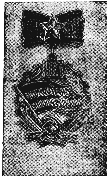
Единый общесоюзный знак «Победитель социалистического соревнования 1973 года».

Но давайте остановимся. Мы же ведь разбираемся не в судебном деле, а в самой рядовой ситуации, возникшей на производстве, где люди думают и трудятся над общим делом. Где начало конфликта? Работники отдела вышли на техсовет с предложением. Это уже хорошо только потому, что они проявили инициативу, пусть, допустим, ошибаясь в