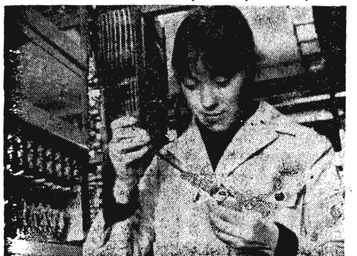
Творческая студия «Панорама».