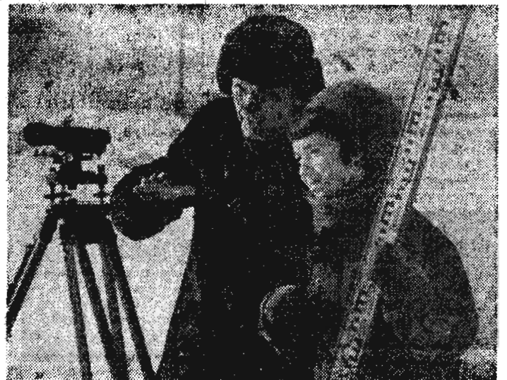
ного цеха Запсиба растет с каждым днем. На снимках: На одном из участков строительства второго конверторного цеха.

Трудовой энтузиазм на строительстве второго конвертор-