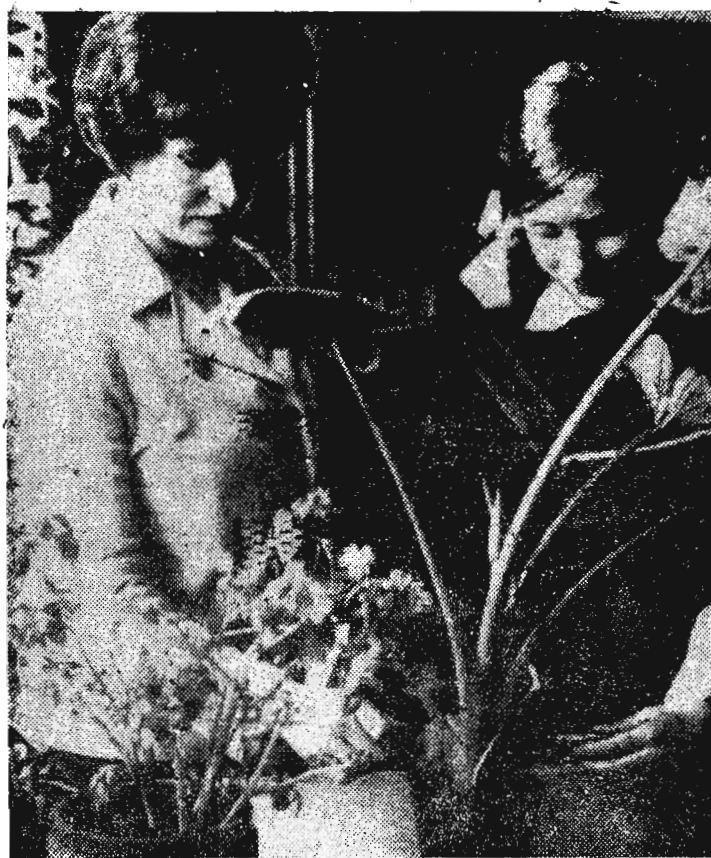
ЗАДУШЕВНЫЙ РАЗГОВОР