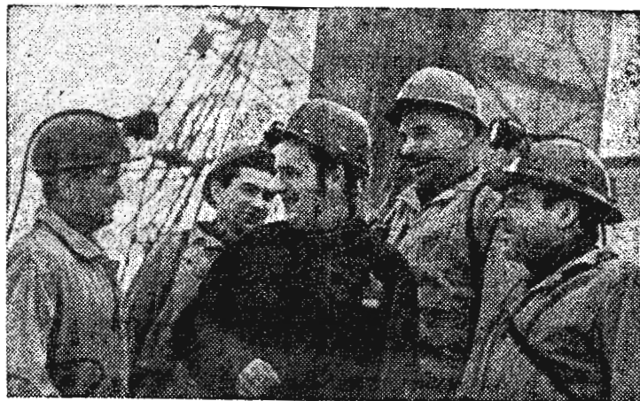
Шахта «Плехановская» — одна из передовых на комбинате «Тулауголь».

Она успешно выполняет программу третьего года пятилетки. С начала года потребителю отправлено более трех тысяч тонн угля сверх плана. Эти показатели достигнуты благодаря комплексной механизации и автоматизации шахты, умелому использованию техники.