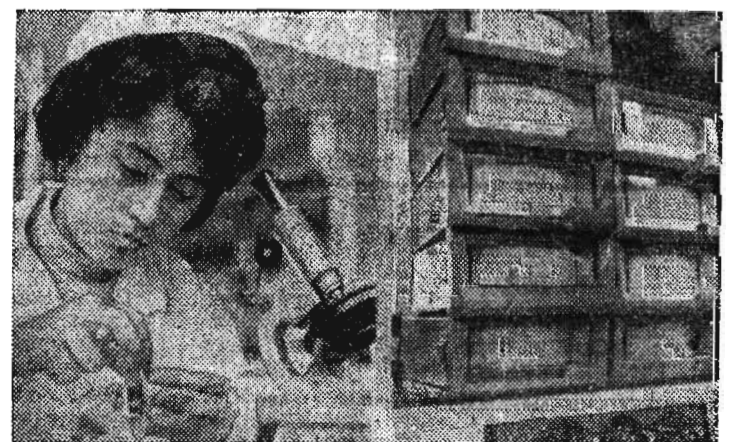
Температуру в пределах минус 200 — плюс 650 градусов измеряет прибор «Л-65И». К выпуску его приступил Ереванский приборостроительный завод. Основное достоинство новинки — искробезопасность — позволяет применять устройство на взрывоопасных участках горных разработок.

В городе недостаточно продовольственных магазинов и, казалось бы, руководство орсом, в первую очередь, должно быть заинтересовано в увеличении