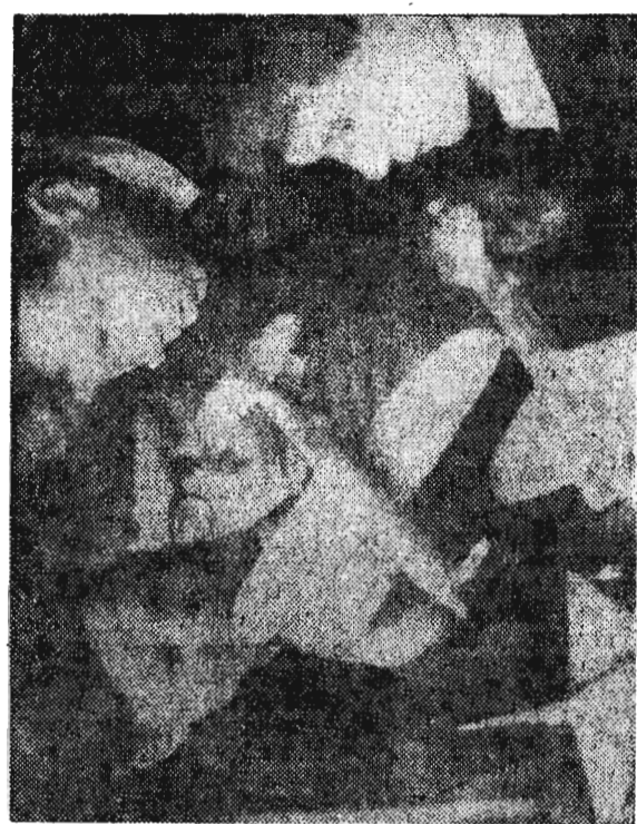
Каждую среду во Дворец пионеров приходят учащиеся школы-интерната № 5. Каждый из ребят находит здесь для себя интересное по душе занятие в каком-нибудь из кружков.