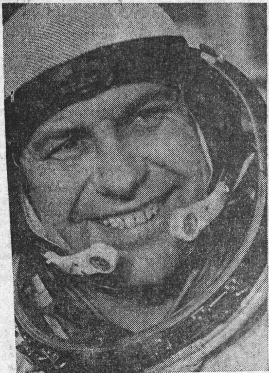
Командир экипажа космического корабля «Союз-14» Павел Романович ПОПОВИЧ — летчик-космонавт СССР, полковник, Герой Советского Союза.