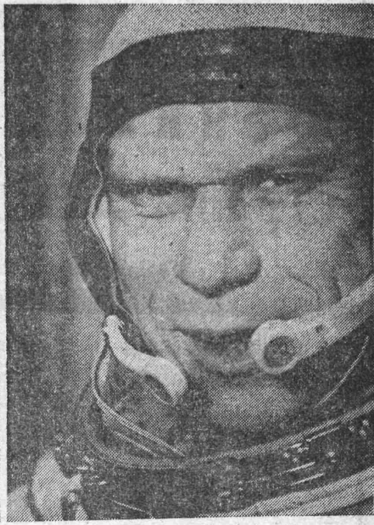
Бортинженер космического корабля «Союз-14» Юрий Петрович АРТЮХИН, подполковник-инженер.