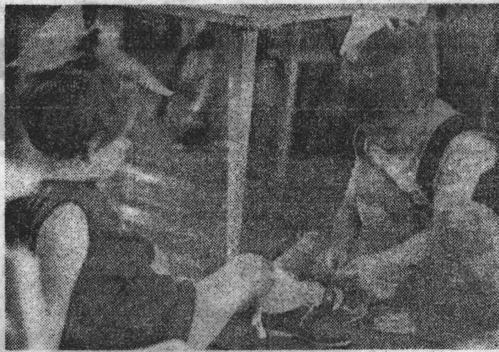
ФОТО САЛОН «ЛЕНИНСКОГО ШАХТЕРА»