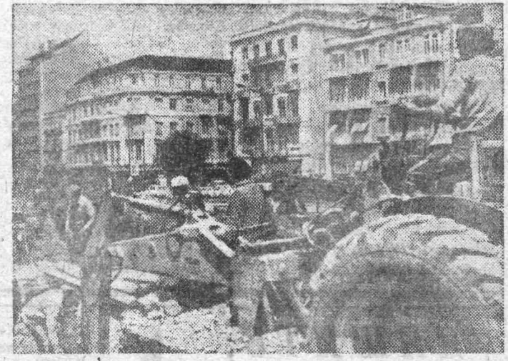
Лиссабон. В португальской столице осуществляется интенсивное строительство жилых домов, прокладывается новая линия метрополитена. На снимке: дорожные работы на проспекте Республики. (Фотохроника ТАСС).