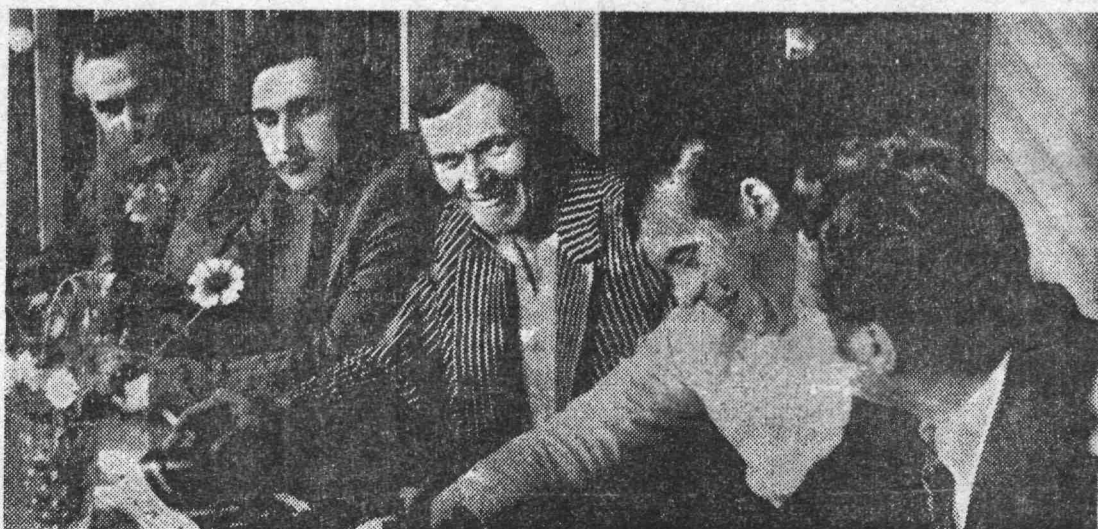
Группа шахтеров Чехословакии во время беседы.