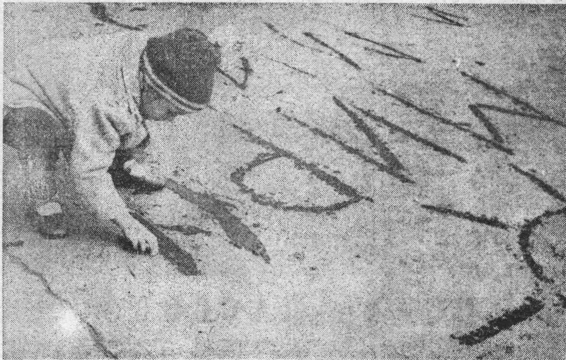
ФОТО САЛОН «ЛЕНИНСКОГО ШАХТЕРА»