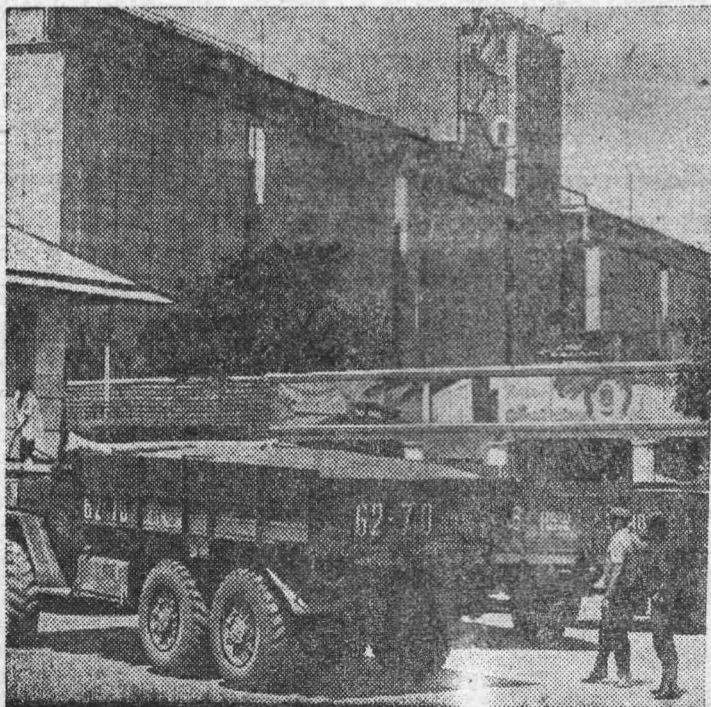
Ставропольский край. Нескончаем поток автомашин с зерном нового урожая. Из хозяйства Петровского и Туркменского районов идут караваны на Светлогорский хлебоприемный пункт (на снимке). Ежедневно элеватор перерабатывает более десяти тысяч тонн зерна.