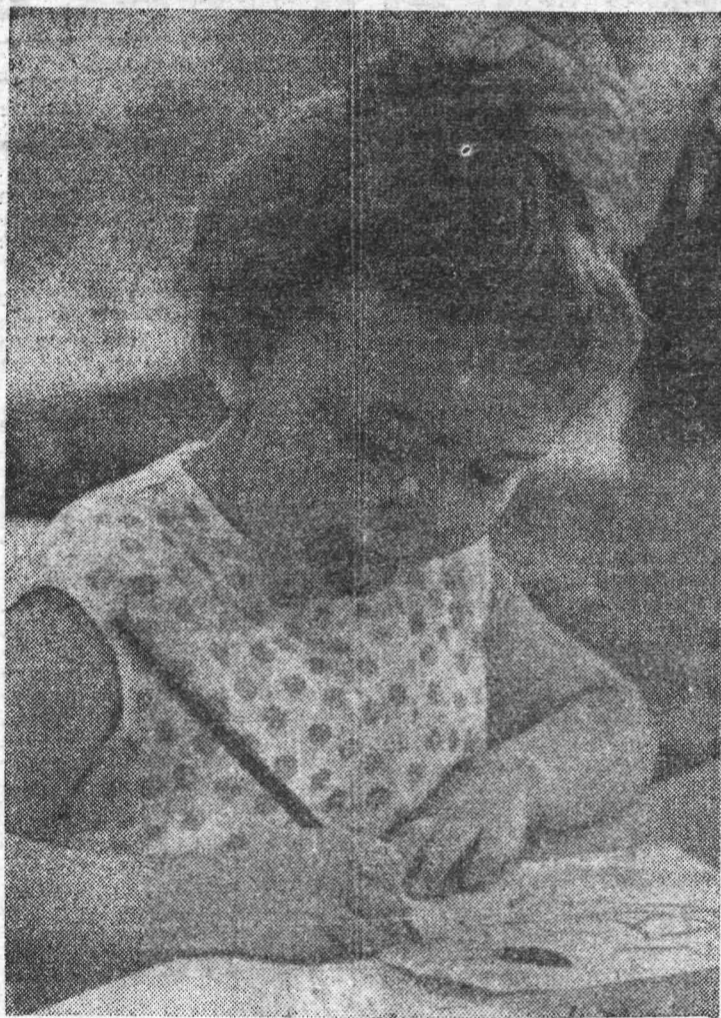
ФОТО САЛОН «ЛЕНИНСКОГО ШАХТЕРА»

● Масло, на котором вы уже жарили, можно использовать еще раз. Процедите его и добавьте несколько капель лимонного сока. Исчезнет запах и вкус горелого.