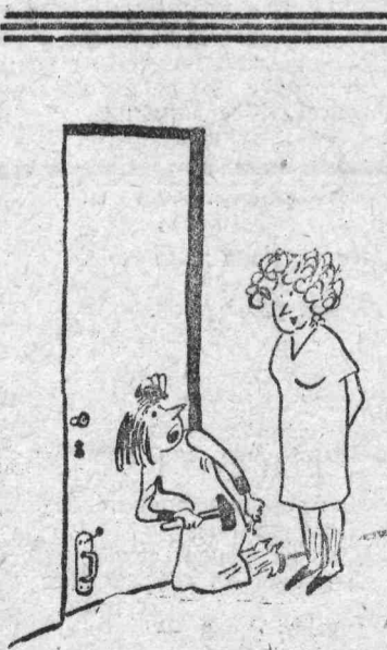
Сегодня у моего полчка... Рис. В. ЗЕМЛЯНОГО.