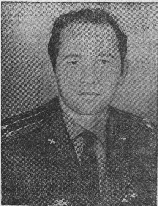
Командир космического корабля «Союз-15» подполковник Геннадий Васильевич Сарафанов.