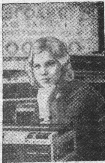
Литовская ССР. Среди любителей музыки популярны магнитофоны «Дайна».

Недавно рабочие объединения изготовили миллионный магнитофон «Дайна».