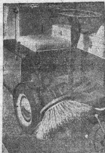
Москва. Большая межотраслевая тематическая выставка «Малая механизация в строительстве» открыта на ВДНХ СССР.

На снимке: аккумуляторный самоходный механизм АПСМ-1 для механизированной уборки в летнее время тротуаров и дворовых территорий.