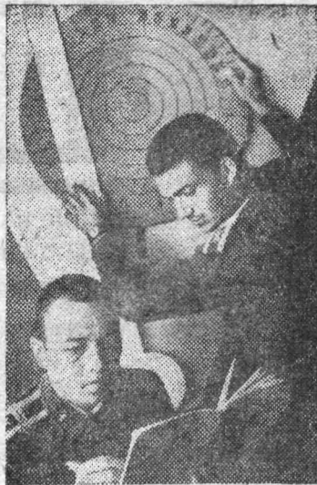
Идут полеты курсантов Саратовского военного авиационного училища летчиков.

Полеты — это завершающая стадия подготовки будущих летчиков, а начинаются они в учебных классах, где курсанты усваивают знания по физике и технической механике, математике и аэродинамике, радиоэлектронике и автоматике.