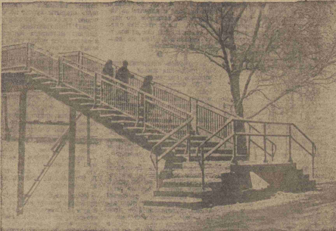
ФОТО САЛОН «ЛЕНИНСКОГО ШАХТЕРА» В ЗИМНЕМ НАРЯДЕ

Вобрать в себя неистовство потерь, И вазой сделать тонкие осколки, Спаси тебя, мой беззащитный зверь, От двух зрачков охотничьей двустволки, Пророговать медленный закат, Прийти в лесу на чье-то пелелище. Насобирать таинственных заплат — Веселых, ярких, разноцветных листьев. И все забыть! Вступить в прохладный мир. Бежать легко по выпуклому насту. Себя венком из осени украсить, И быть такой, чтоб ты не разлюбил, Мой храм осенний! Где усталый пень, Где бегают березы на ходулях, Где прячется мой беззащитный зверь От колкого неправосудья пули. Спасу тебя! Иди к моим рукам, Уйдем с тобой из золотого леса, Я не отдам. Не выдам. Не предам, Уйдем — так вместе! И умрем — так вместе! Г. ЗОЛОТАИНА.