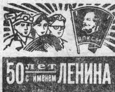
Фото 1927 года.