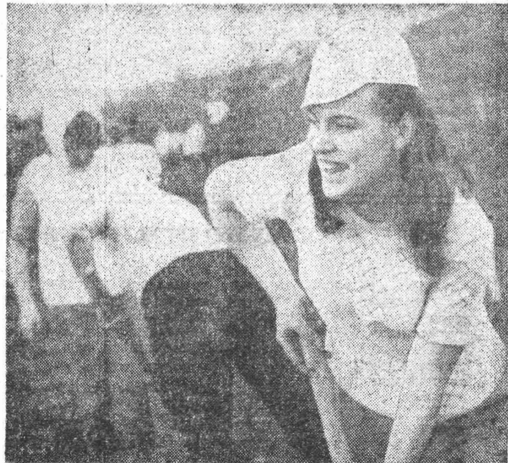
Фото и текст В. Даникова.

Выпускники с шутками, веселым смехом приступают к колке ям под молодые деревца. Одна за другой встают белоствольные березки в ровные ряды аллеи будущего парка.