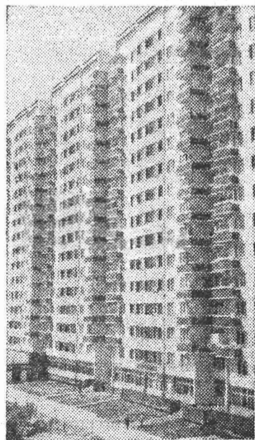
цированных изделий единого каталога.