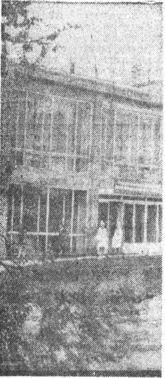
Центральная городская больница № 1.