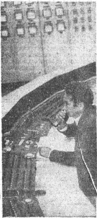
Первая очередь АСУ на шахте «Октябрьская».