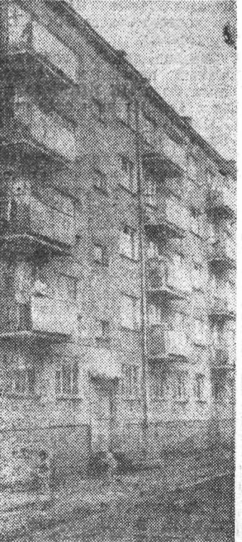
Общежитие камвольно-суконного комбината.