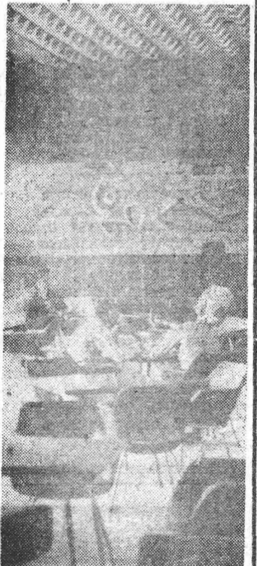
Столовая на 100 мест на шахте «Октябрьская».