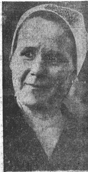
Двадцать три года работает