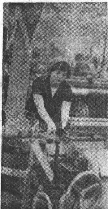
Кандидат в члены КПСС