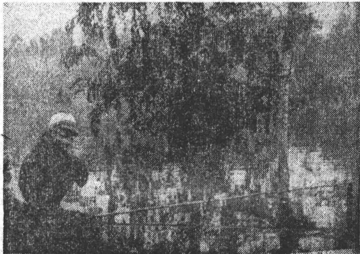
САША - РЫБАЧОК.