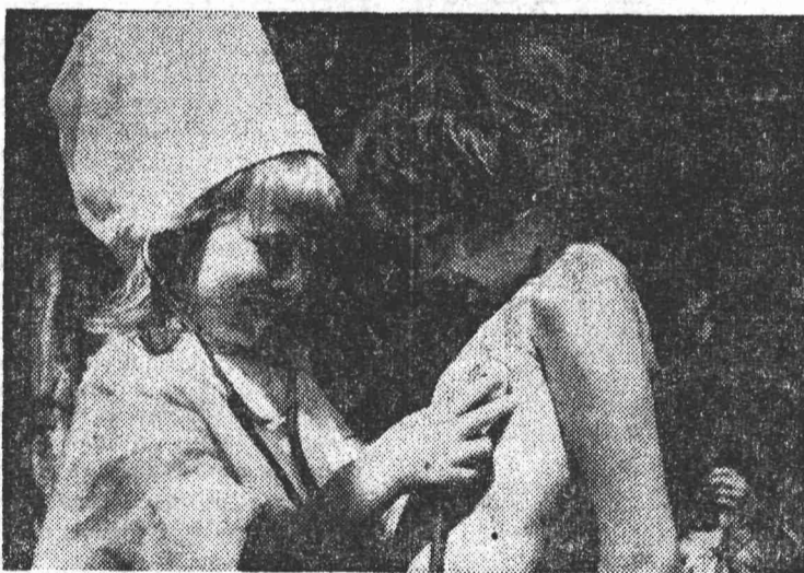
ХОЧУ БЫТЬ ДОКТОРОМ.