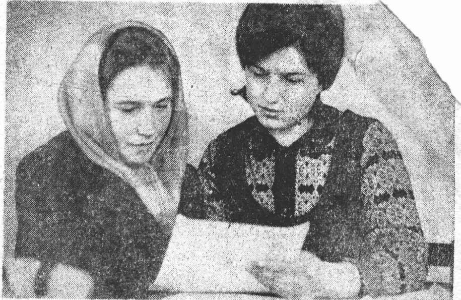
Недавно народные контролеры мебельной фабрики провели рейд по соблюдению режима сушки пиломатериалов. Они отметили, что температура сушки нарушается. А это отрицательно влияет на качество продукции.