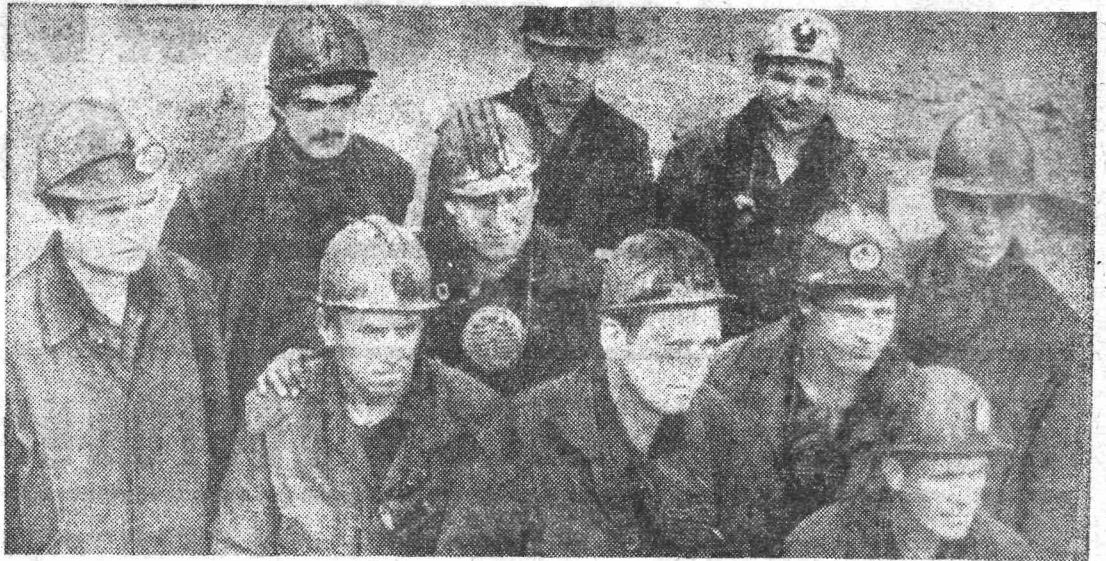
На шахте имени Ярославского, как и прежде, лидирует в соревновании среди очестных комплексная бригада П.