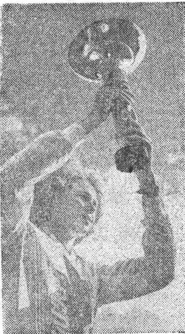
изводственного объединения, победительница в забегах на 100 и 200 метров Татьяна Голубева с призом.