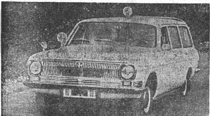
С конвейера Горьковского автозавода сошли первые десятки машин медицинской службы ГАЗ-24-03 — третьей модификации «Волги». Они заменят устаревшие модели автомобилей такого назначения.