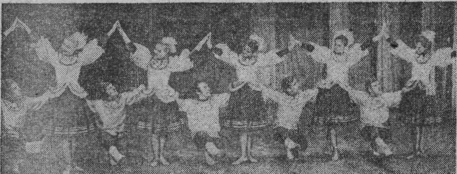
ВОЛОГОДСКАЯ ОБЛАСТЬ. Самодеятельный танцевальный ансамбль

«Северные зори» — один из старейших художественных коллективов горо-