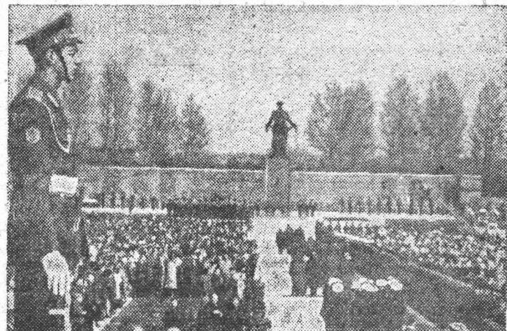
Ленинград. На Пискаревском мемориальном кладбище.