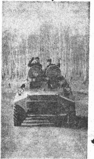
● ПОСЛЕ УЧЕНИЙ.