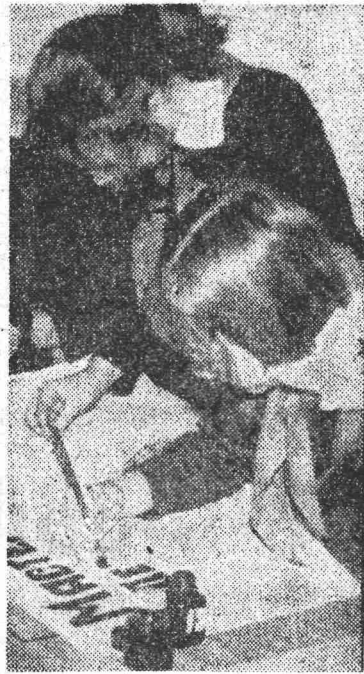
ПРОДЛЕННЫЙ ДЕНЬ В ШКОЛЕ № 46