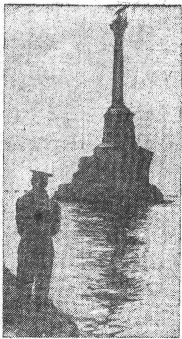
Памятник затонувшим кораблям в городе-герое Севастополе.