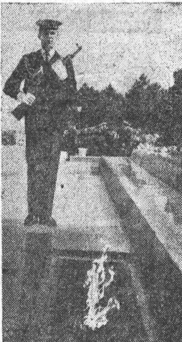
СЕВАСТОПОЛЬ, У Вечного огня на Сапун-горе, зажженного в честь освободителей города.