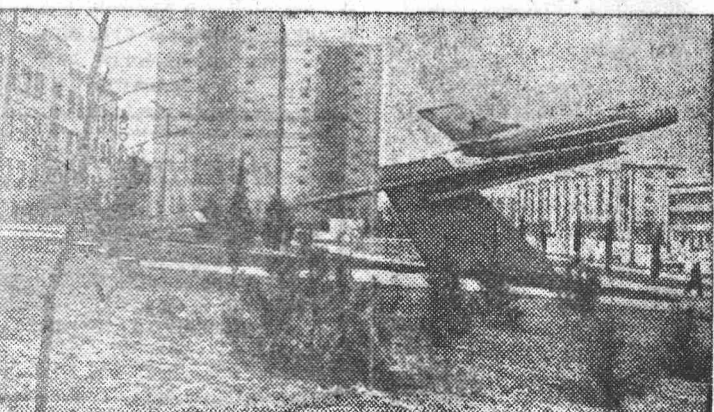
СЕВАСТОПОЛЬ. На улице имени Героя Советского Союза Н. А. Острякова.