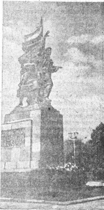
НОВОРОССИЙСК. Памятник воинам-защитникам Новороссийска на площади Свободы.