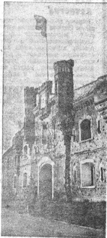
БРЕСТ. Подвигу, совершенному защитниками города, посвящен мемориальный комплекс «Брестская крепость-герой».