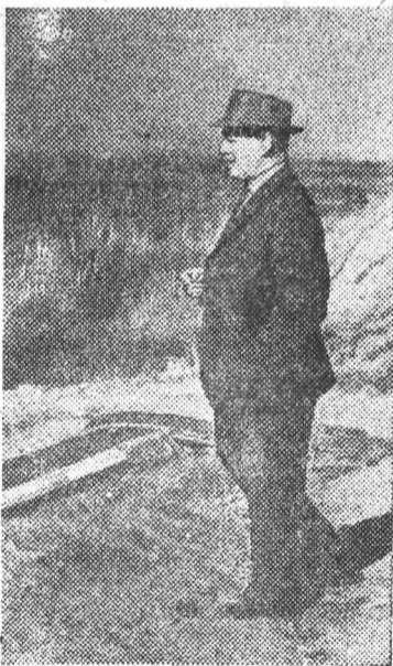
М. А. Шолохов на берегу родного Дона в Вешенской.