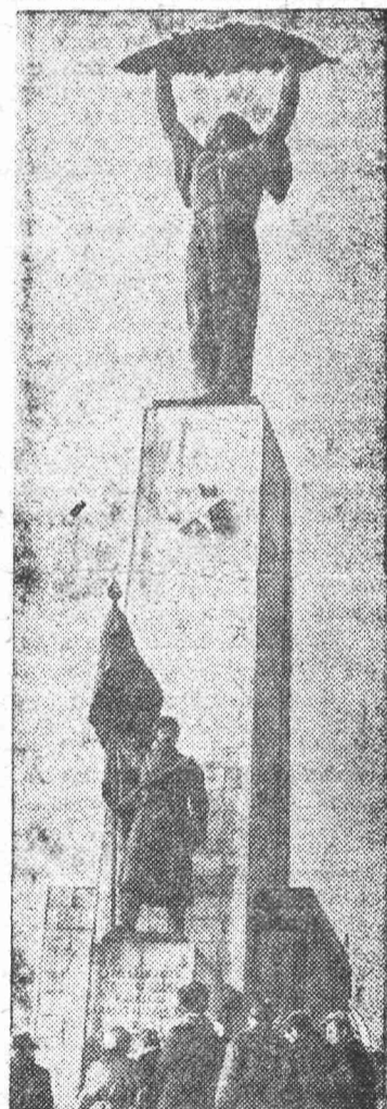
БУДАПЕШТ. Женщина, поднявшая над головою пальмовую ветвь мира, и застывший в вечном карауле советский солдат... Памятник работы венгерского скульптора Жигмонда Кишфалуди-Штробля установлен на возвышающейся над городом горе Геллерт.