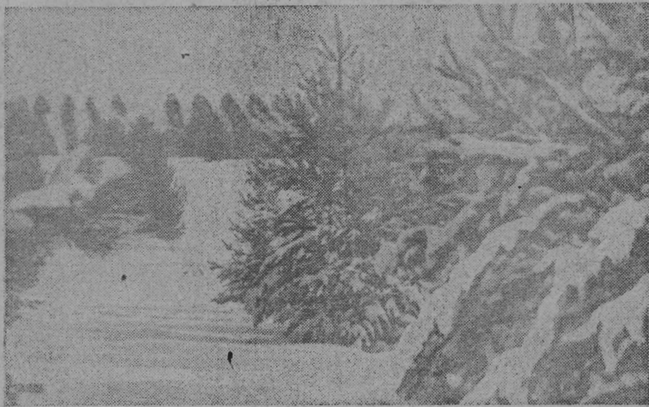
ЗИМНИЙ ПОЛДЕНЬ В ЛЕСУ.